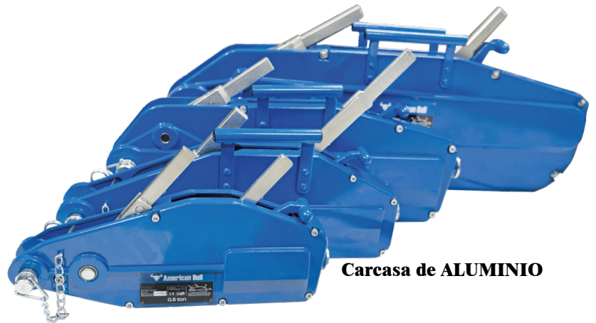
Carcasa de ALUMINIO

Equipado con mordazas de precisión y palancas de tracción manual , permite elevar, arrastrar o tensar cargas con total seguridad. Su sistema de tracción por cable de acero y mordazas autoblocantes de alta eficiencia garantiza una sujeción firme, estable y un control óptimo del esfuerzo aplicado.